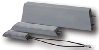
Резисторы ZC-BR-80W ... ZC-BR-1000W в алюминиевом корпусе

пар – параллельная схема, пос – последовательная схема, (пос)пар – комбинированная схема